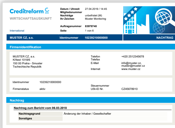
Nachtrag zur Wirtschaftsauskunft International