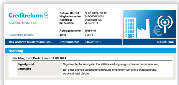
Signal Bonität Nachtrag